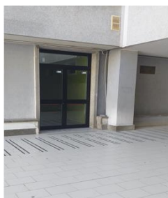
Ingresso lato palestra fitness B