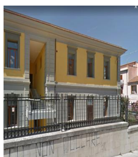
Scala esterna B