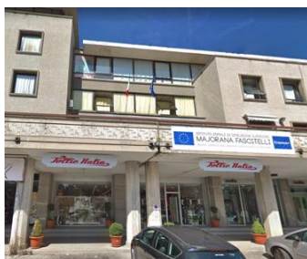
Portone principale A